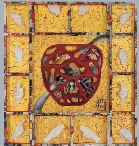
《Sign Language》1996/2010年、福岡市美術館蔵