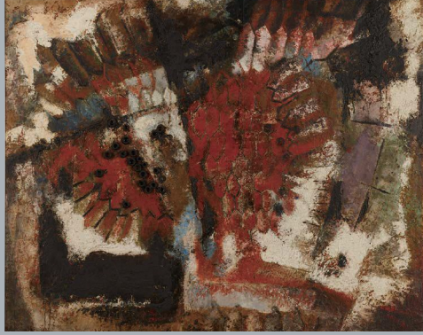
《魚族の怒り》1959年、福岡市美術館蔵

「希望を捨てるわけにはいかなない」——座右の銘だというこの言葉は、田部の美術家としての姿勢を表しています。