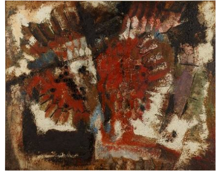
田部光子《魚族の怒り》1959年、福岡市美術館蔵