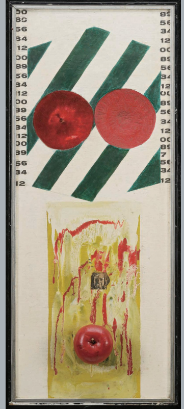
《たった一つの实在を求めて》1963年、福岡市美術館蔵