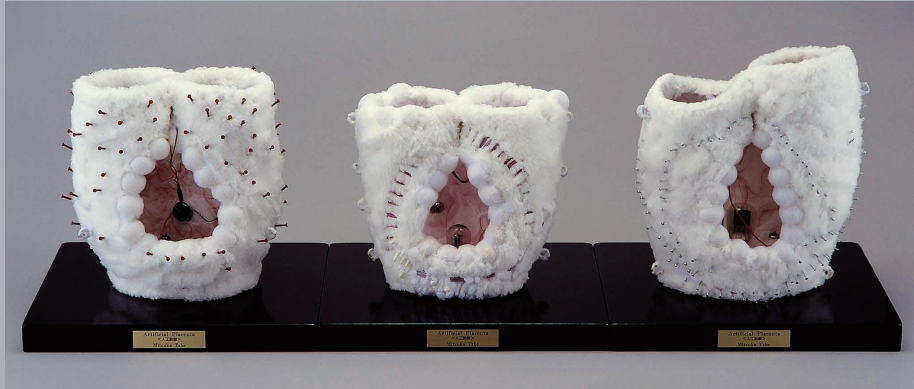
《人工胎盤》1961年(2004年再制作)、熊本市現代美術館蔵