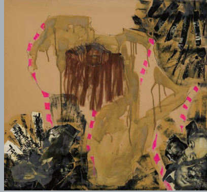
《プラカード》1961年、東京都現代美術館蔵