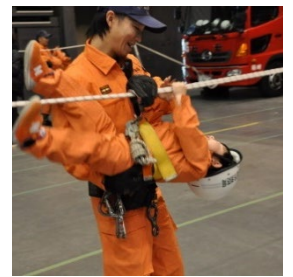
ちびっこレスキュー体験