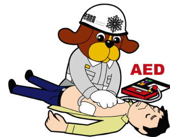
福岡市消防局マスコットキャラクター ファイ太くん