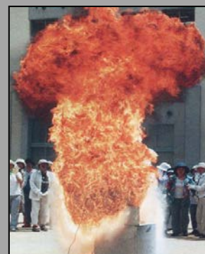
発火した天ぷら鍋に水をかけた様子

消火器を使って消すか、近くに消火器がない場合は、濡らしたタオル等で鍋全体を覆うように被せて消火します。