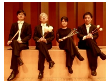
九州交響楽団 打楽器メンバー