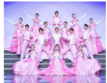
歌劇ザ・レビュー