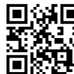
Web ページ 二次元コード

【開始日】 令和3年11月15日（月） 【Web ページ URL】 fukuoka360.jp 【Instagram アカウント】 fukuoka360