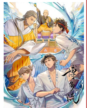
オリジナルキャラクター「ナガマサ」が活躍する音声ドラマ「博多流れ」

※コンテンツをより安全・快適に楽しむことができる骨伝導イヤホンの無料貸出（期間限定）を、11月25日（木）から、JR博多駅総合案内所、「博多町家」ふるさと館、アジア美術館の3か所で始めます。