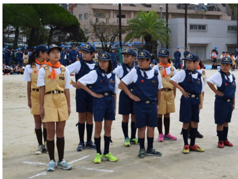
旧制服(全国的に普及)

活 動 内 容：①公民館から水防倉庫まで「おさんぽ」しながら、気づいたこと(危ない場所等)を地図に書き込み、グループでまとめた地図を発表。 ②水防倉庫にて、簡単な水防工法(土のうを積む訓練等)を予定。 ※雨天時は、公民館にてDIG研修等を実施。(取材可能)