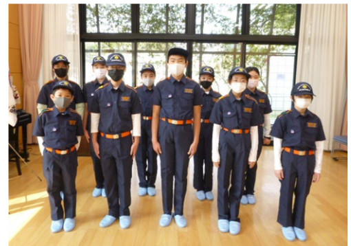
新制服(福岡市オリジナル)