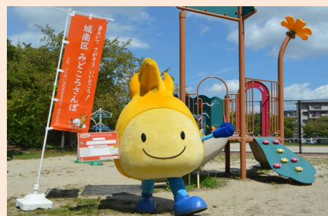
のぼり旗を目印にキーワードを探そう