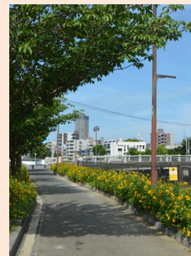
城南区鳥飼校区の見どころ 塩屋橋とハミングロード