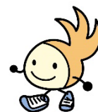
城南区シンボルキャラクター 油山の妖精 ニッコりん

城南区では、心のふれあいを醸成し、心豊かで明るいまちづくりを推進するために地域振興事業を実施しています。例年秋には大規模集客イベント「ふれあい城南フェスティバル」を実施していますが、新型コロナウイルス感染症の拡大に伴い、今年度は代替事業として、集まらずに、時間や場所にとらわれず、 各自思い思いの散歩を楽しむイベント「城南区みどころさんぽ」を開催します。