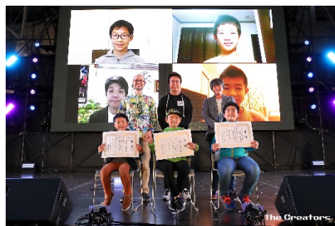
表彰式の昨年度の様子

「フクオカクリエイターズアワード」とは、「未来のクリエイターとなる子供たちにフォーカスする」という趣旨で2017年度から開催している小・中学生向けのプログラミングコンテスト(テーマ：SDGs)で、その表彰式をクリエイターズで開催します。