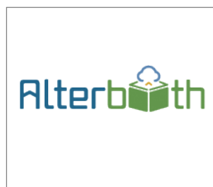
No.7 株式会社オルターブース