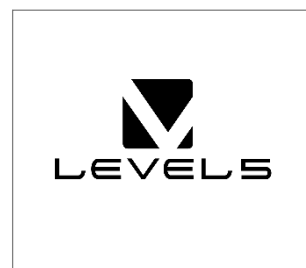
No.12 株式会社レベルファイブ