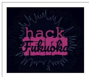
No.6 Hack Fukuoka