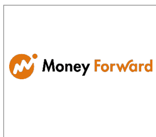
No.10 株式会社マネーフォワード