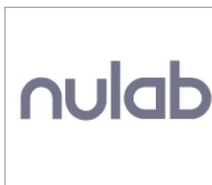
No.6 株式会社ヌーラボ