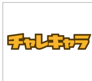
No.3 九州アプリチャレンジ・キャラバン