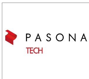
No.2 株式会社パソナテック