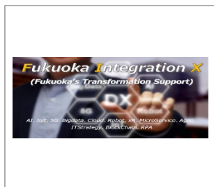
No.1 Fukuoka Integration X