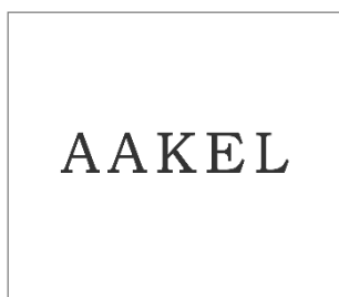
No.14 アークエルテクノロジーズ株式会社