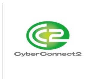
No.11 株式会社サイバーコネクトツ