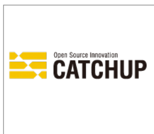
No.9 株式会社キャッチアップ