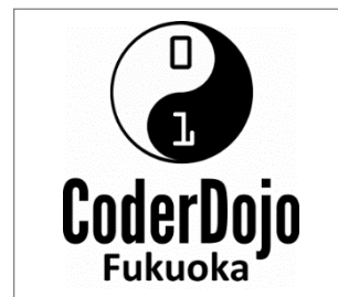
No.4 CoderDojo 福岡