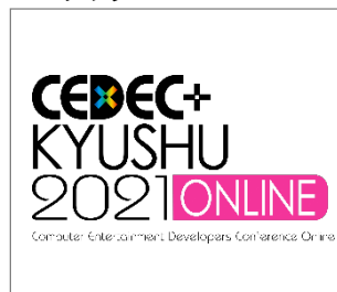
No.7 CEDEC+KYUSHU 実行委員会