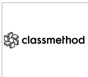
No.1 クラスメソッド株式会社