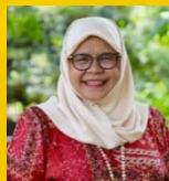
国連ハビタット事務局長 マイムナ・モハメッド・シャリフ氏