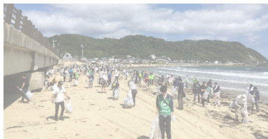
ラブアース・クリーンアップ清掃イベントの様子

「ごみを拾うことをきっかけに、ごみを捨てる人を無くし、環境について考え、行動する人を増やしたい」という思いで、このシンポジウムを開催いたします。