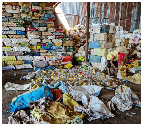
Cagayan de Oro City

海洋プラスチックごみの約8割は私たちが住む陸上から流れたものと言われており、海洋ごみ問題の解決に向け、世界の国々や都市、地域コミュニティ等と連携し様々な提言やプロジェクトを行っています。