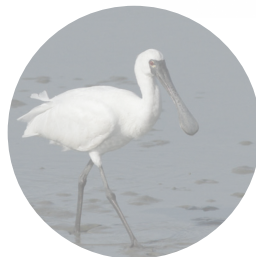
クロツラヘラサギ