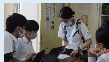
ポスター制作の様子