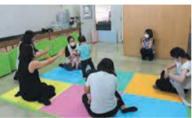
親子遊びで楽しむ参加者

子どもの発達の悩みを他のお母さんたちと共有できることがうれしいです。毎回楽しく参加できています。