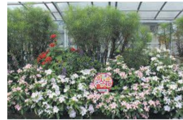
華やかな花壇は日々の手入れのたまもの

市は、企業や個人などが民有地で花づくり活動を行い、街に彩りと潤いを与える花壇を「一人一花パートナー花壇」として登録しています。今年新たに登録された二つの企業の花壇を紹介しします。