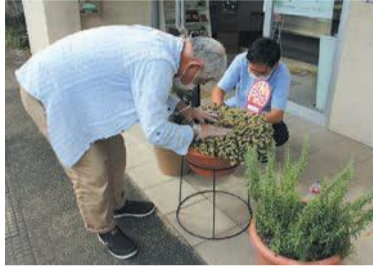
心を込めて手入れをしています

「一人一花オリジナルプレート」を配付 グッデイ松原店、ふくおかフラワー老司店などの対象店舗で、花苗・園芸用品購入の割引(一人一花割引)その他の特典や申請等についての詳細は、市ホームページ(「一人一花パートナー花壇」で検索)で確認するか下記担当課に問い合わせを。