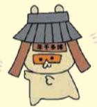
博多の魅力発信会議公認キャラクター「せんねもん」

区ホームページ(「ウォーキングせんねもん」で検索)では、「せんねもん」がウォーキングコースや準備体操の仕方などを動画で紹介しています。