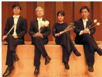
打楽器アンサンブルの九州交響楽団メンバー

28日(日)午前10時～正午には、九州交響楽団メンバーによる打楽器アンサンブルのステージが行われます。曲目は、ハチャトゥリャン作曲「剣の舞」、エックハルト・コペツキ作曲「蛇の歌」など。クラリネット、コントラバス、ピアノおよび津軽三味線が融合した音楽も楽しめます。📄抽選400人📄無料📄往復はがきかメールで住所、氏名、年齢、電話番号を区生涯学習推進課(☎645-1144 📠651-5097📧h-gakushu@city.fukuoka.lg.jp)へ。10月29日(金)必着。グループでの申し込みは3人まで。年齢制限はありません。3歳未満は保護者と同じ席となります。