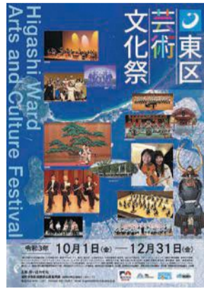
東区芸術文化祭のポスター

区は、気軽に芸術文化に触れることができ、心豊かに生き生きと暮らせるまちづくりを進めるため、10月から12月にかけて東区芸術文化祭を開催します。音楽、演劇、舞踊、写真展などさまざまなイベントが行われます。また、期間中はなみきスクエア（千早四丁目）で九州産業大学の学生が制作したオブジェを展示するほか、一部の校区で文化祭も開催されます。文化の秋、芸術の秋をお楽しみください。詳しくは、区ホームページ（「東区芸術文化祭」で検索）や、区役所、なみきスクエア、区内公民館で配布するリーフレットをご覧ください。右コードからもアクセスできます。☎区企画振興課 ☎645-1037 📠651-5097