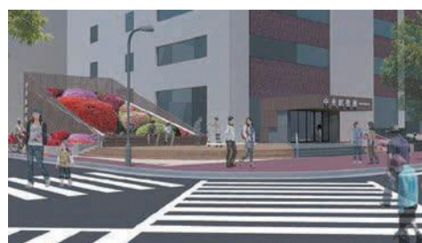
中央区役所玄関前広場完成イメージ

天神地区では、アジアの拠点都市としての役割・機能を高め、新たな空間と雇用を創出するプロジェクト「天神ビッグバン」を推進しています。国家戦略特区による「航空法高さ制限の特例承認」や市独自の容積率緩和制度などを組み合わせ、ソフト・ハード両面にわたる施策を一体的に推進することで、民間活