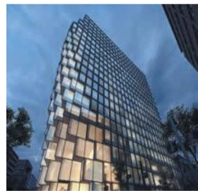
天神ビジネスセンター

健康(検)診の日程や実施医療機関を紹介しています。年齢と性別を入力すると、自分に合った健康(検)診科目が表示されるほか、予約もできます。