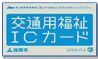
交通用福祉ICカード

高齢者乗車券の交付には、申請が必要です。令和3年度の高齢者乗車券の申請が済んでいない人は、郵送かオンラインで申請してください。申請すると、自宅に交付決定通知書やタクシー助成券等が届きます。