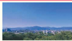
南公園西展望台からの風景 (中央区探検隊リサーチャー撮影)

区の人口 207,527人 (前月比4人増) (男 93,161人 女 114,366人) 世帯数 129,072世帯 (前月比32世帯減) (令和3年8月1日現在推計)