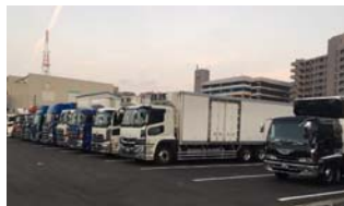
陸路による集荷・出荷