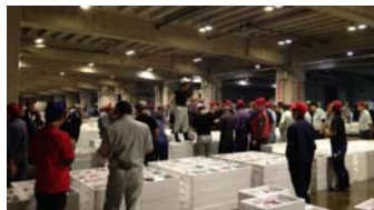
卸売場棟（セリの様子）