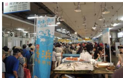
仲卸売場棟を市民に開放