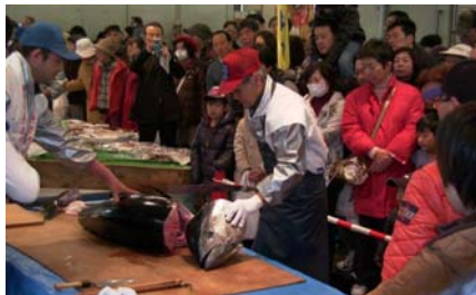
マグロの解体表演