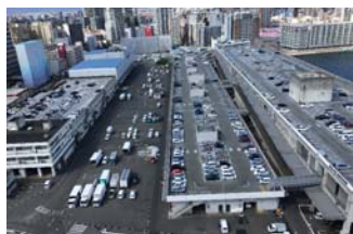
立体駐車場棟・仲卸売場棟・西卸売場棟