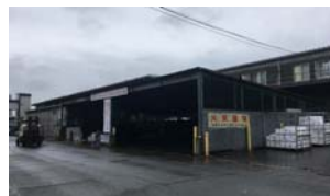
廃棄物処理施設 (発泡スチロール集積所)