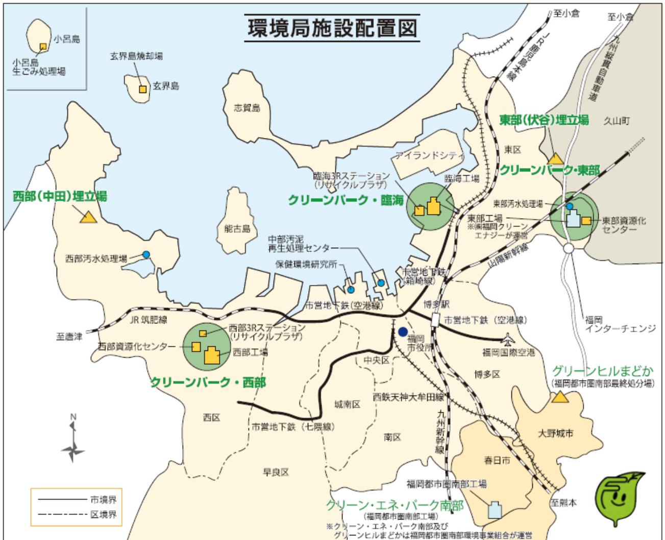
■ 図表 41 環境局施設配置図 (2021年度(令和3年度)時点)