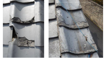
瓦が著しく破損している例