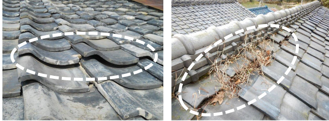
瓦に浮き上がりが生じている