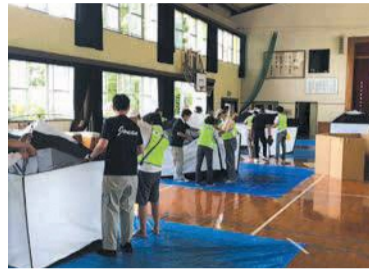
テントの設置手順を確認します

堤地区で7月25日(日)に地域の人が中心になって避難所設置スタッフ訓練が行われ、55人が参加しました。