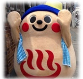
福岡市支部キャラクター 「温（おん）まるくん」