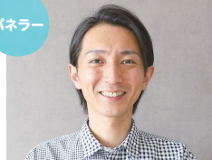
かずえちゃん リモート出演

「LGBTQって身近にいるよ」「あなたは1人じゃないよ」と伝えるため、動画配信や交流などに力を注ぐ。