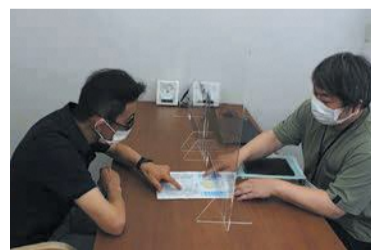
個別のスペースを用意しています ※相談のイメージ

区内に3カ所ある「区障がい者基幹相談支援センター」は、障がいのある人やその家族が、安心して暮らし続けられるように支援を行っています。一人一人に応じた支援