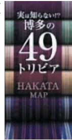
今年3月に改訂された「博多の49トリビア」

今年6月からはパンフレット「実は知らない!?博多の49トリビア」=写真=に関連したクイズを実施し、博多の豆知識を広めています。