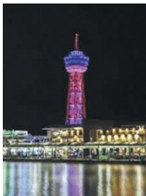
ライトアップされた ベイサイドプレイス博多

令和2年11月に開設したInstagram版「博多の魅力」では、博多の街並みの写真や、区内の専門学校生が制作した動画などを投稿しています。また、季節に合わせた短い動画など、旬の情報を発信しています。