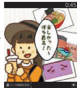
生徒が制作した博多を題材にした動画

博多の歴史や観光情報など詳しくは、ホームページ（「博多の魅力」で検索）をご覧ください。