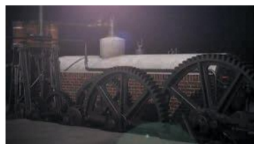
小菅修船場の引き揚げ装置

ギアを作って、ものを動かす仕組みについて学びます(小学生以上推奨)。☎8月27日(金)～29日(日)午後2時半～4時☎各日6人(先着)☎無料☎ホームページで8月1日以降に受け付けます。