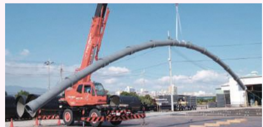
耐震管の吊上げ実験の様子