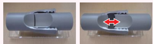
縮んだ状態の耐震管(模型) 伸びた状態の耐震管(模型)

管の継ぎ目が伸び縮みする構造となっており、地震の揺れに対しても柔軟に対応することができます。