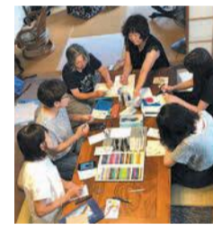
絵札作成の合宿の様子(令和元年8月撮影)