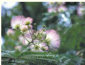
ネムノキ (油山市民の森)