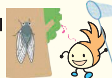
区のシンボルキャラクター 油山の妖精「ニコりん」

〒814-0192 城南区鳥飼六丁目1-1 窓口受付時間:午前8時45分~午後5時15分 (土日・祝休日・年末年始を除く) 区ホームページは「福岡市城南区」で検索