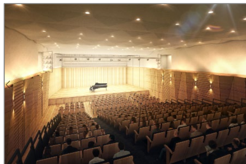
最大300人収容可能な多目的ホール