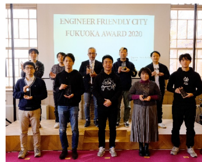
昨年の表彰式の様子

※詳細は、別添の応募要項及び Web サイト ( https://efc.fukuoka.jp/award2021 ) をご参照ください。