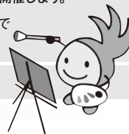
城南区のシンボルキャラクター 油山の妖精「ニコリん」

趣 旨 「城南区市民アート展」は城南区の文化活動を促進し、発表や鑑賞の場を提供することにより、美術活動の振興や市民のコミュニティづくりの推進、青少年の健全育成を図ることを目的として開催します。 会 期 令和3年12月14日(火)～19日(日) 9:30～17:30 ※入館は17:00まで 会 場 福岡市美術館(中央区大濠公園1-6) 2階ギャラリーA・B・C・D・E