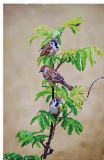
【写真部門】 六山 茂樹 様「雀の自粛」