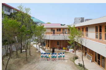
市民賞 平尾保育園