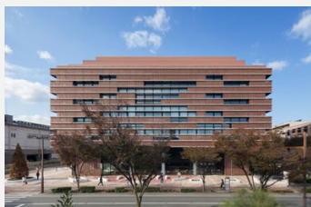
大賞 西南学院大学図書館