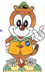
地下鉄マスコット ちかまる