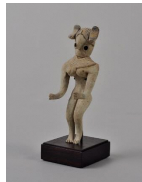
《女性土偶》パキスタン 紀元前3000～前2500年頃 森田コレクション

夏休みこどもギャラリーの作品をみんなでおしゃべりしながらオンラインでいっしょにみてみよう。