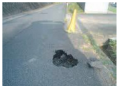
舗装の破損、くぼみ、穴