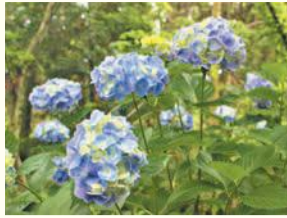
飯盛山のアジサイ