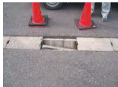
側溝・側溝ふたの破損

台風や大雨で被害が発生する場合があります。道路や照明灯の異常を見つけたら、電話でご連絡ください。登録している人は、福岡市LINE(ライン)公式アカウントからも連絡できます。