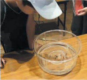
メダカについて楽しく学べます

メダカの特徴や育て方、取り巻く環境について、西区まるごと博物館推進会会員が解説します。 期7月24日(土) 午後2～4時(受け付けは1時半から) 所西市民センター視聴覚室 定抽選で30人 料無料 申画はがき、ファクスまたはメールに、イベント名、住所、氏名(ふりがな)、年齢、電話番号を書いて、7月12日(月)必着で同会事務局(〒819-8501住所不要、区企画振興課内 ☎895-7032 ☐885-0467 ✉shinko.event24@city.fukuoka.lg.jp)へ。抽選結果は7月19日(月)までに発送します。