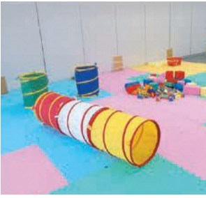
おもちゃで遊べます

子どもの発達が気になる保護者が一息つける空間です。専門スタッフを交えて親子遊びや交流会を行います。