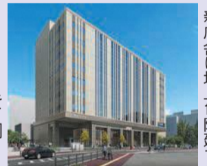
新庁舎は地上10階建て

窓口サービスの充実を図り、窓口混雑の緩和と待ち時間の短縮を目指します。現在は別の場所にある保健福祉センターも同じ建物内になります。調 区 総 務 課 ☎419-1004 F452-6735