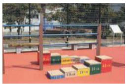
福浜公園 (福浜二丁目)

閤区維持管理課 ☎718-1085 ☎718-1079/ 区地域保健福祉課 ☎718-1111 ☎771-4955