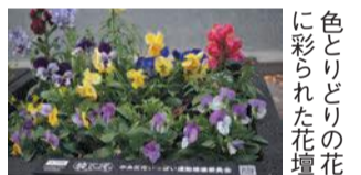
色とりどりの花に彩られた花壇