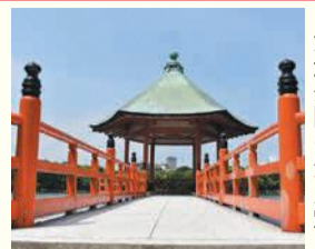
大濠公園の浮見堂

区の人口 204,588人 (前月比7人増) (男 91,484人 女 113,104人) 世帯数 126,621世帯 (前月比97世帯増) (令和2年9月1日現在推計)