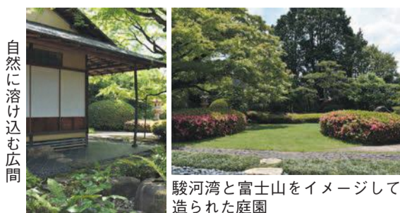
自然に溶け込む広間

庭園には樹齢100年を超えるイロハモミジがあり、四季の移り変わりを感ずることが出来ます。茶室「松風庵」は、京都の数寄屋師が地元から材料を取り寄せて建て、当時の状態のまま保存されています。また、茶道具のなつめなどの彫刻を施した、全国唯一の棗灯籠があります。