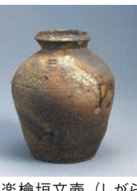
信楽檜垣文壺(しがらきひがきもんこ) 室町時代 15世紀

胸が膨らんだ「袋物」と呼ばれる器を展示します。開6月15日(火)～8月29日(日) 一般200円、高大生150円、中学生以下・市内に住む65歳以上無料