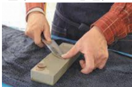
過去の「ボランティアが教える包丁研ぎ講座」

一部講座は材料を持参。市内に住むか通勤・通学する人 ※①4歳～小学生と保護者②小学生以上と保護者③①1人100円②500円③④⑤⑦⑩無料(③⑩は部品代別)⑥400円⑧500円⑨1組300円⑪①②④⑤⑥⑧⑨往復はがきかファクス、来所で、7月①②①日④⑤日⑥日⑧日⑩⑬日⑭日(いずれも必着)までに同施設へ。ホームページでも受け付けます。③⑦⑩電話か来所で、7月1日以降に同施設へ。