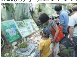
過去の同イベント

開8月1日(日)午後1時半～3時半 小学4～6年生 20人(抽選) 無料 往復はがきかファクスに応募事項とファクスの場合はファクス番号も書いて、7月18日(必着)までに同園へ。ホームページでも受け付けます。