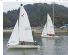
過去の初心者ヨット教室

開7月3日(土)午前10時～午後4時 市内に住む16歳以上 10人(先着) 3,000円 往復はがきで6月15日以降に受け付けます。