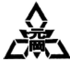
福岡市立元岡小学校