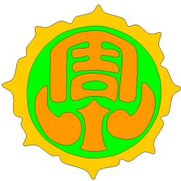
福岡市立周船寺小学校