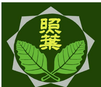
福岡市立照葉小学校