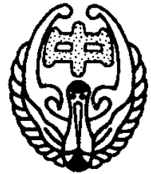
福岡市立元岡中学校