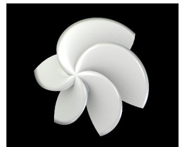
福岡市立西都小学校