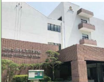
博多工業高等学校