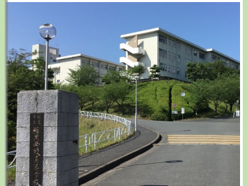
福岡西陵高等学校