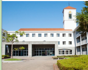
福岡女子高等学校