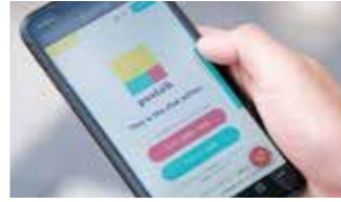
【2022年度認定】 postalk postalk株式会社