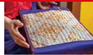
【2022年度認定】 Obi活 万華鏡