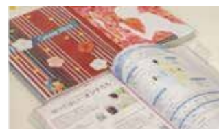
【2022年度認定】 てのひら美術館手帳 株式会社シーノ・オフィス