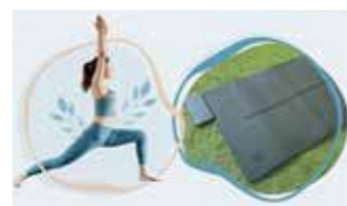
【2022年度認定】 yoctoMat® ヨクト株式会社