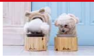
【2022年度認定】 [kinoaru]ペットフードボウル 株式会社イーフラット