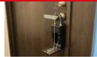
【2023年度認定】 スマートキーボックス KEYes 株式会社