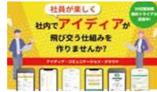
【2021年度認定】 Hirame-ku 株式会社Tobe-Ru