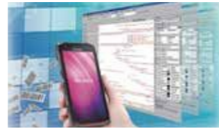
【2021年度認定】 無線バーコードシステム 株式会社ユニティクス