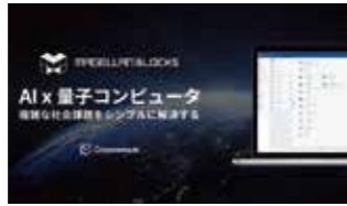
【2021年度認定】 MAGELLAN BLOCKS 株式会社グルーヴノーツ