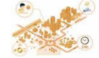
【2023年度認定】 マチエンス MATIENCE (人流・交通量調査パッケージ) 62Complex株式会社