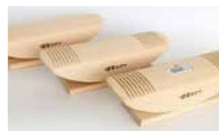
【2022年度認定】 あしふみ健幸ライフ 健幸ライフ株式会社