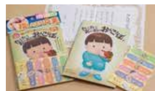
【2021年度認定】 指しゃぶり卒業キット たこたこおにおにおんころぼい 株式会社アリーナ