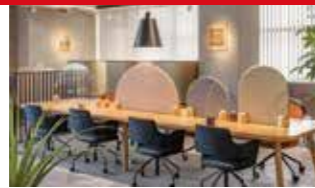
【2021年度認定】 ACカーム 株式会社アダル