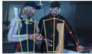
【2022年度認定】 AI行動解析システム「VP-Motion」 株式会社ネクストシステム