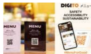
【2021年度認定】 DIGITOMENU DOKOJAPAN株式会社