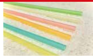
【2022年度認定】 米ストロー 株式会社UPay