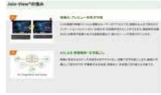
【2021年度認定】 Join-View® 株式会社ユニゾンシステムズ