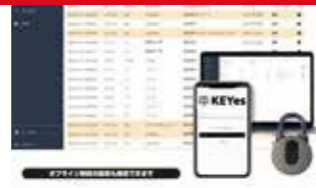
【2023年度認定】 オフライン解錠機能付きスマートロック KEYes 株式会社