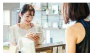
【2022年度認定】 toypo 株式会社トイゴ