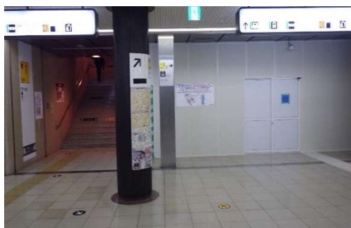
現在の東1出入口の状況