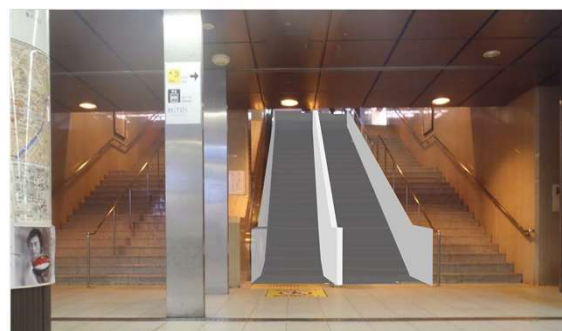
エスカレーター設置後のイメージ