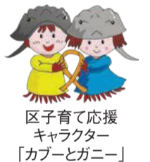
区子育て応援キャラクター「カブーとガニー」

「しつけ方が分からない」「子育てが負担に感じる」など、子どもに関する相談を、電話や窓口で受け付けています。困ったときは、一人で悩まず、気軽にご利用ください。