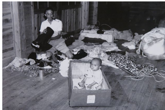
博多埠頭内宿泊所で荷物の整理を行う満州引揚者

写真は分かりやすく、モノ資料には説得力がある。 写真とその写真に写っているモノ資料をあわせて展示することで、キャプションだけでは伝わらない当時の様子をうかがい知ることができる。