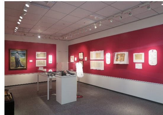
【参考】ドライマウント加工パネルを設置した展示室（平和祈念展示資料館）