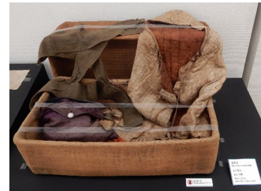
赤ん坊のおくるみなどを入れた柳行李 (福岡市所蔵)