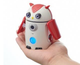
ヘルスケア AI ロボット「ZUKKU」