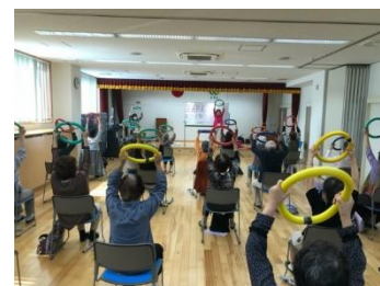
サロンの開催イメージ