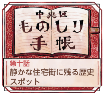
第十話 静かな住宅街に残る歴史スポット

豊かな自然と歴史資源が魅力的な平尾校区の見どころを紹介します。 ○平尾山荘 平尾5丁目の「平尾山荘」は左写真は、幕末の勤王歌人・野村望東尼が暮らした庵を復元したもので、かやぶき屋根が特徴的です。 望東尼は夫とともに、大隈言道に師事して和歌を学び、40歳の時にこの地に転居しました。当時、森と田んぼしかなかった平尾村の向陵に庵を建てて庭を造り、夫婦で歌作りに励みながら暮らしていたそうです。