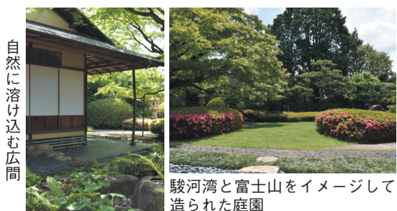
自然に溶け込む広間