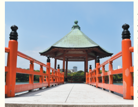
大濠公園の浮見堂

区の人口 204,588人 (前月比7人増) (男 91,484人 女 113,104人) 世帯数 126,621世帯 (前月比97世帯増) (令和2年9月1日現在推計)