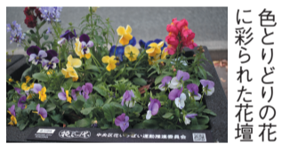
色とりどりの花に彩られた花壇