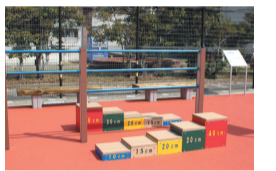
福浜公園 (福浜二丁目)

☎区維持管理課 ☎718-1085 ☎718-1079/ 区地域保健福祉課 ☎718-1111 ☎771-4955