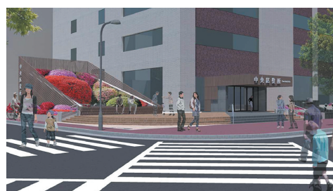
中央区役所玄関前広場完成イメージ