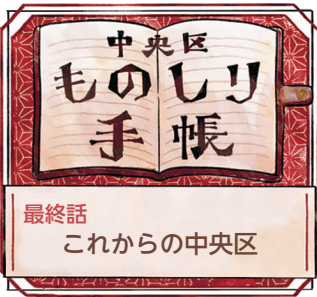
最終話 これからの中央区

令和2年8月15日号から連載していた、中央区の豆知識を紹介する「中央区ものしり手帳」。今号で、最終話となります。