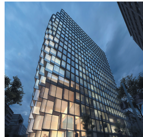
天神ビジネスセンター

国家戦略特区による「航空法高さ制限の特例承認」や市独自の容積率緩和制度などを組み合わせ、ソフト・ハード両面にわたる施策を一体的に推進することで、民間活