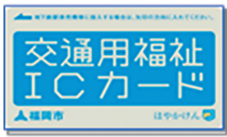
交通用福祉ICカード

高齢者乗車券の交付には、申請が必要です。令和3年度の高齢者乗車券の申請が済んでいない人は、郵送かオンラインで申請してください。申請すると、自宅に交付決定通知書やタクシー助成券等が届きます。