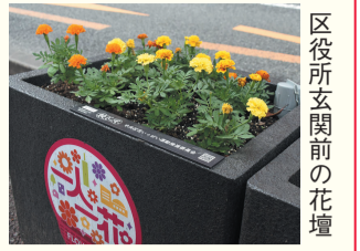
区役所玄関前の花壇

区の人口 207,523 人 (前月比 34 人減) (男 93,109 人 女 114,414 人) 世帯数 129,104 世帯 (前月比 24 世帯減) (令和3年7月1日現在推計)