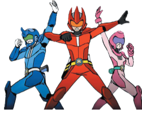
日本食品衛生キャラクター 食中毒防止隊 タベルマン

8月1日(日)から、区ホームページ(「タベルマン 手洗い教室」で検索)で「プロの和菓子作りとタベルマンの手洗い教室」の動画を公開します。食中毒や新型コロナウイルス感染症などの予防の基本は手洗いです。石けんをよく泡立て、洗い残しがないようにしっかり洗い、食中毒や感染症を防ぎましょう。