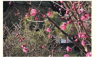
平尾山荘の梅の花

区の人口 207,378人 (前月比112人減) (男93,309人 女114,069人) 世帯数 129,266世帯 (前月比123世帯減) (令和4年1月1日現在推計)