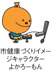
市健康づくりイメージキャラクター よからーもん

●家庭血圧の測り方 家庭血圧は、朝と夜の1日2回の測定が推奨されています。朝は起床後1時間以内に、トイレを済ませて朝食前に測定します。夜は入浴や飲酒の直後を避け、寝る前に測りましょう。