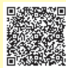
区ホームページはこちら

新型コロナウイルス感染症拡大防止のため、一部の健診などが中止・延期（状況によっては、再開）になる場合があります。実施については、事前にホームページまたは、各問合わせ先にご確認ください。