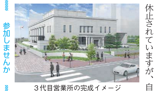
3代目営業所の完成イメージ

今年(令和3年)は支店開設80周年。日本銀行福岡支店は、昭和16(1941)年に、福岡市天神町(現在の西鉄イン福岡敷地)に開設されました。その後、昭和26(1951)年に現在の天神四丁目2代目営業所が移転しました。