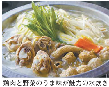
鶏肉と野菜のうま味が魅力の水炊き

豊富な自然に恵まれた福岡は、多くの新鮮な食材が手に入ります。また、古くから大陸との交流が盛んだったことから、相手に学び、地元の食材でもてなす気質が育まれました。福岡の豊かな「食」は、多くの人を引き付ける魅力の一つです。