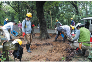
樹木の手入れをする皆さん

南公園で6月19日、自然豊かな森を手入れする活動「植物園里山ボランティア」が行われました。この活動は、市動物園とみどり運営課、NPO法人グリーンシティ福岡が共働で令和元年度から実施している「まちなか里山事業」の一環で、今年で3年目になります。