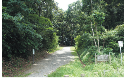
動物園北側にある南公園の入口

📅=日時、期間 📍=場所 👤=対象 🧑=定員 💰=料金、費用 📄=申し込み 🗨️=問い合わせ ☎️=電話 📠=ファクス 📧=メール 📎=持参 🕒=受付時間