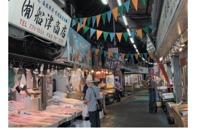
威勢のいい掛け声が響く市場

締めちゃんぽんは、天神にあるもつ料理店の大将が、兼業していた中華料理店のちゃんぽん玉を拝借して鍋に入れたのが始まりです。滋味あふれる「おきゅうと」は、海藻の「エゴノリ」が原料で、江戸時代に編さんされた『筑前国産物帳』に「うけう」として紹介されています。以前は早朝に売り歩く行商人の音が町に響くほど、朝食には欠かせない物でした。