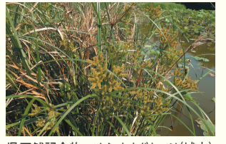
県天然記念物・ツクシオオガヤツリ(城内)

区の人口 207,557人 (前月比205人増) (男93,132人 女114,425人) 世帯数 129,128世帯 (前月比177世帯増) (令和3年6月1日現在推計)