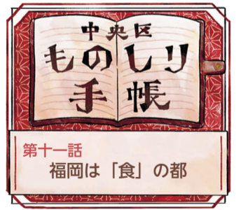
豊富な自然に恵まれた福岡は、多くの新鮮な食材が手に入ります。また、古くから大陸との交流が盛んだったことから、相手に学び、地元の食材でもてなす気質が育まれました。福岡の豊かな「食」は、多くの人を引き付ける魅力の一つです。

「もつ鍋」は、もつ肉とニラをアルミ鍋でしようゆ味に炊いたもので、戦後、朝鮮半島から来て炭鉱で働いていた人たちが作り始めたそうです。