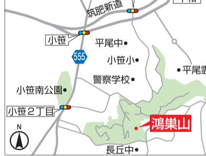
南公園西展望台と展望台があります。

振山などの山、遠くは糸島半島まで見渡せます。マテバシイの樹林広がる鴻巣山 鴻巣山は、市の中心から約4km離れた、中央区と南区の境に位置する丘陵地です。景観に優れた緑地を守り、良好な都市環境を維持するため、市は昭和50年、「鴻巣山特別緑地保全地区」に指定し、都心部のレクリエーションエリアとして保全しています。